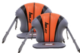
Sièges Kayak gonflables x2