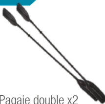
Pagaie double x2