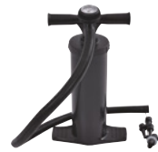
Pompe double flux